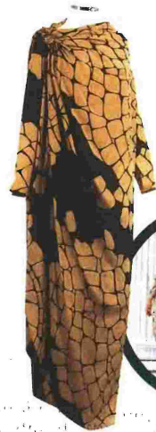
Φόρεμα από τη συλλογή του Γιάννη Τσεκλένη «Μακεδονικά Μωσαϊκά», εμπνευσμένη από τα μωσαϊκά της Πέλλας (Χειμώνας 1981)