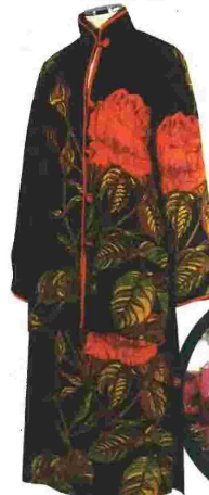
Σύνολο αποτελούμενο από ζακέτα και φούστα προερχόμενο από τη συλλογή του Γιάννη Τσεκλένη «Τριαντάφυλλα και άλλα ζώα» (1980)