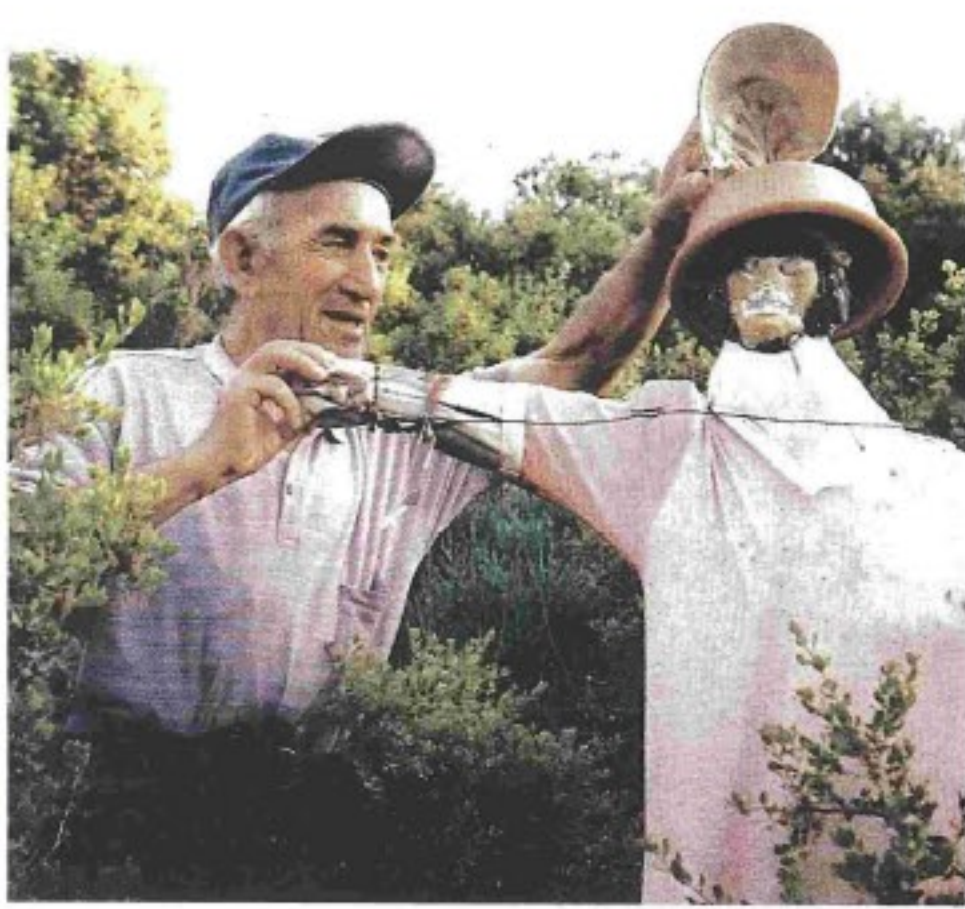
Ο φωτογραφικός φακός του Γιώργου Αντωνίου έπιασε μια στιγμή της ζωής στην ύπαιθρο της Αργολίδας. Εδώ, στο χωριό Μερκούρι ο εικονιζόμενος αγρότης εν μέσω θάμνων στολίζει το σκιάτρω του με μια πλαστική λεκάνη στο κεφάλι

«Πολλά σκιάτρω είναι παραγεμισμένα με άχυρο ή με ροκανίδι ή με μικροκλαδιά με φύλλα. Αυτά είναι πιο ανθρωπόμορφα. Υπάρχουν και εκείνα που είναι απλά ντυμένα, με ένα κενό πουκάμισο, που όμως πάλλεται περισσότερο και με το παραμικρό θρόισμα - και άρα μοιάζουν ακόμη πιο ανθρωπόμορφα».